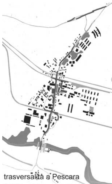
trasversalità a Pescara