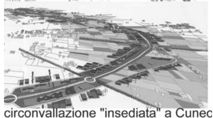
circonvallazione "insediata" a Cuneo

accentuandone il carattere simbolico alla scala del paesaggio e della velocità.